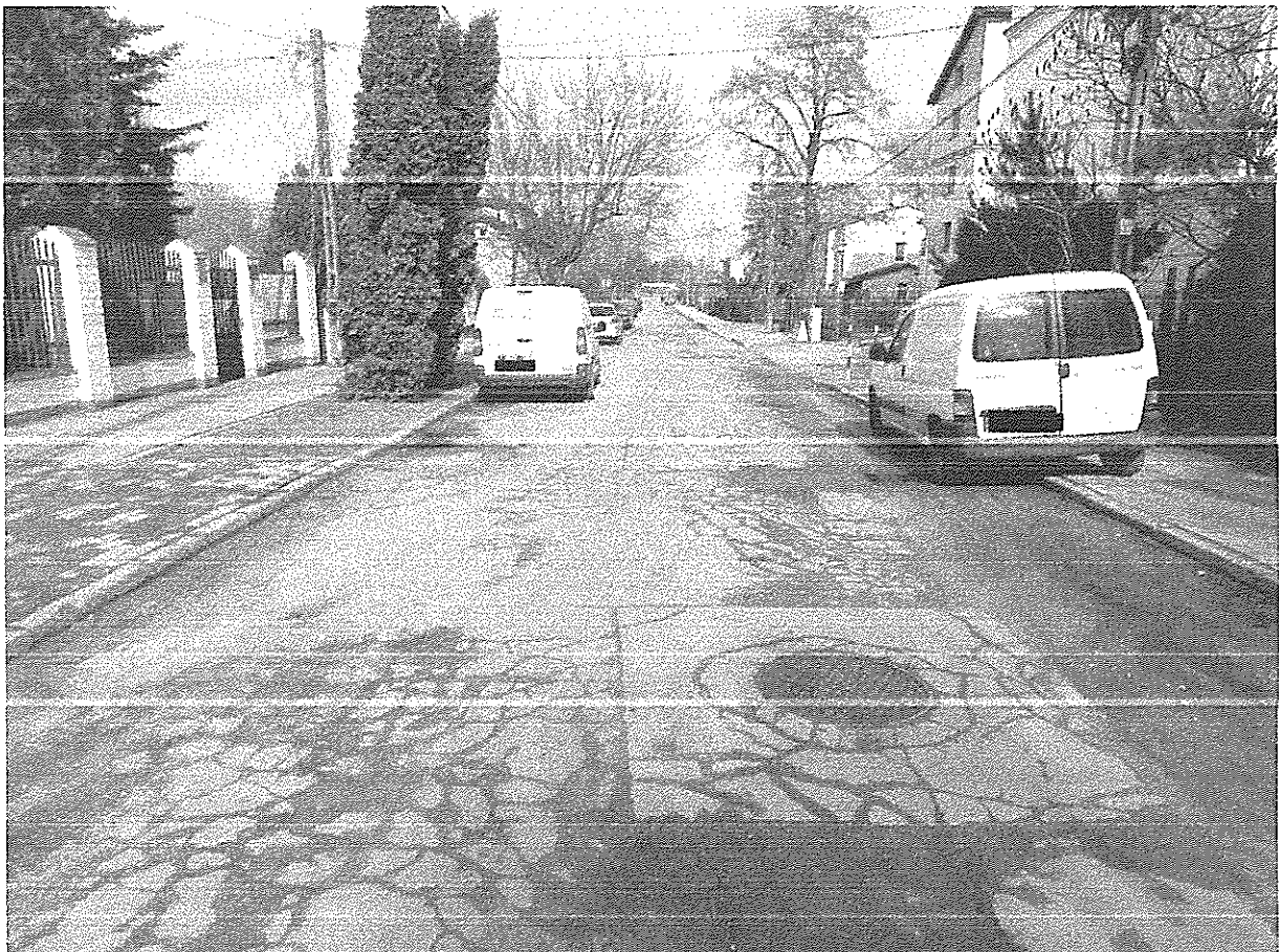
Ul. Królowej Jadwigi

Spis dróg powstał dzięki Waszym wiadomościom. To czytelnicy wysyłali do nas informacje, które drogi są utrapieniem w miastach, miasteczkach i powinny przejść remont. Dzisiaj ogłaszamy wyniki konkursu dla Pruszkowa. Ułożyliśmy drogi, od według nas najlepszej do najgorszej. Z listą zgłosiliśmy się do urzędu miasta, aby poznać przyszłość wytypowanych dróg.